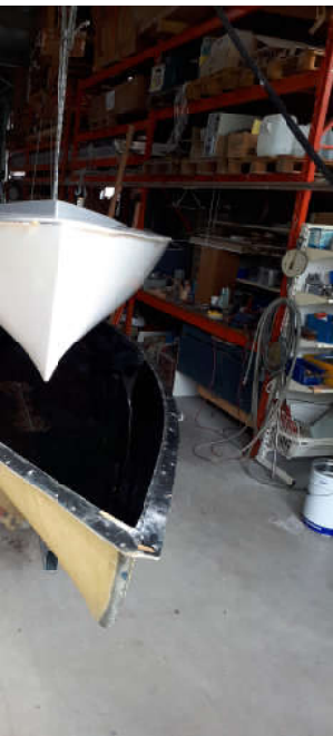
Der fertige Rohbau wird aus der Form entnommen

gestufter Doppelboden mit 3 getrennten Kammern. Gelcoat eingeformter Belag auf dem Plichtboden. Plichtboden komplett in Sandwichbauweise mit einem Anteil multiaxialer Gelege. hoher Spitzenqualität durch konsequenten Einsatz von Materialien und Fertigung.