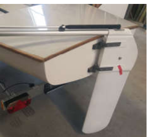
mit profiliertem Blatt